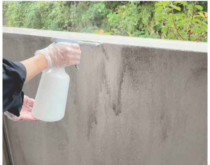
普通の汚れならスプレーや塗布するだけで汚れがどんどん落ちていきます