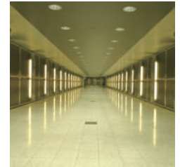
日常の床清掃に… (約 120 倍)