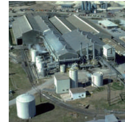
工業用として… (約 30 ~ 50 倍)