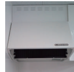
換気扇の油汚れに… (約 30 倍)