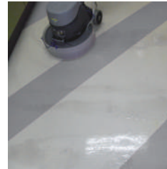
ワックス塗布前の洗浄に… (約 50 倍)

機械の使用方法に沿って使用して下さい。 洗浄面に直接スプレーして、布（クロス）等で拭き取ります。