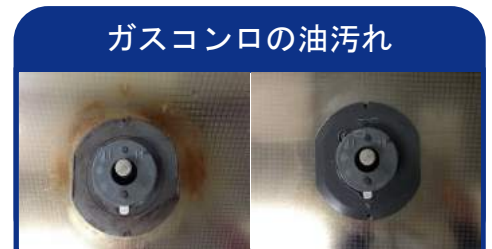
ガスコンロの油汚れ

用途が増えたことにより、重汚染の強力洗剤として一つの製品で対応が可能となり、コスト削減にもつながります。ひどい汚れに対しては原液で使用することにより、時間の短縮につながり、また汚れの度合によって30倍まで薄めてお使い頂けます。