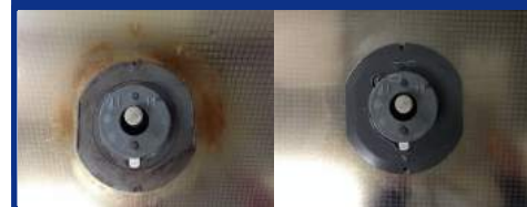
ガスコンロの油污れ

新たに” 油污れ ”と” 皮脂汚れ ”に効果が高い成分を配合し、使用できる幅が広がりました。用途が増えたことにより、重汚染の強力洗剤として一つの製品で対応が可能となり、コスト削減にもつながります。ひどい汚れに対しては原液で使用することにより、時間の短縮につながり、また汚れの割合によって30倍まで薄めてお使い頂けます。