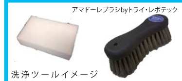
洗浄ツールイメージ