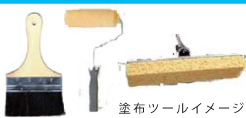
塗布ツールイメージ